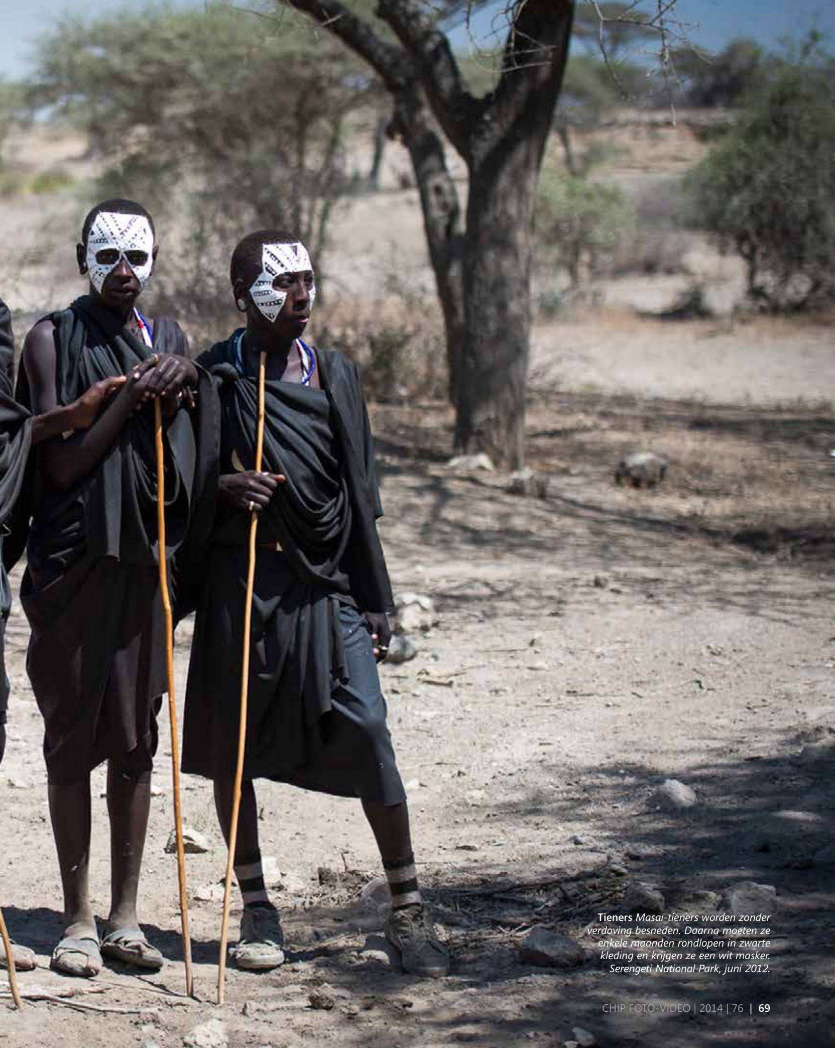
Tieners Masai-tieners worden zonder verdoving besneden. Daarna moeten ze enkele maanden rondlopen in zwarte kleding en krijgen ze een wit masker. Serengeti National Park, juni 2012.