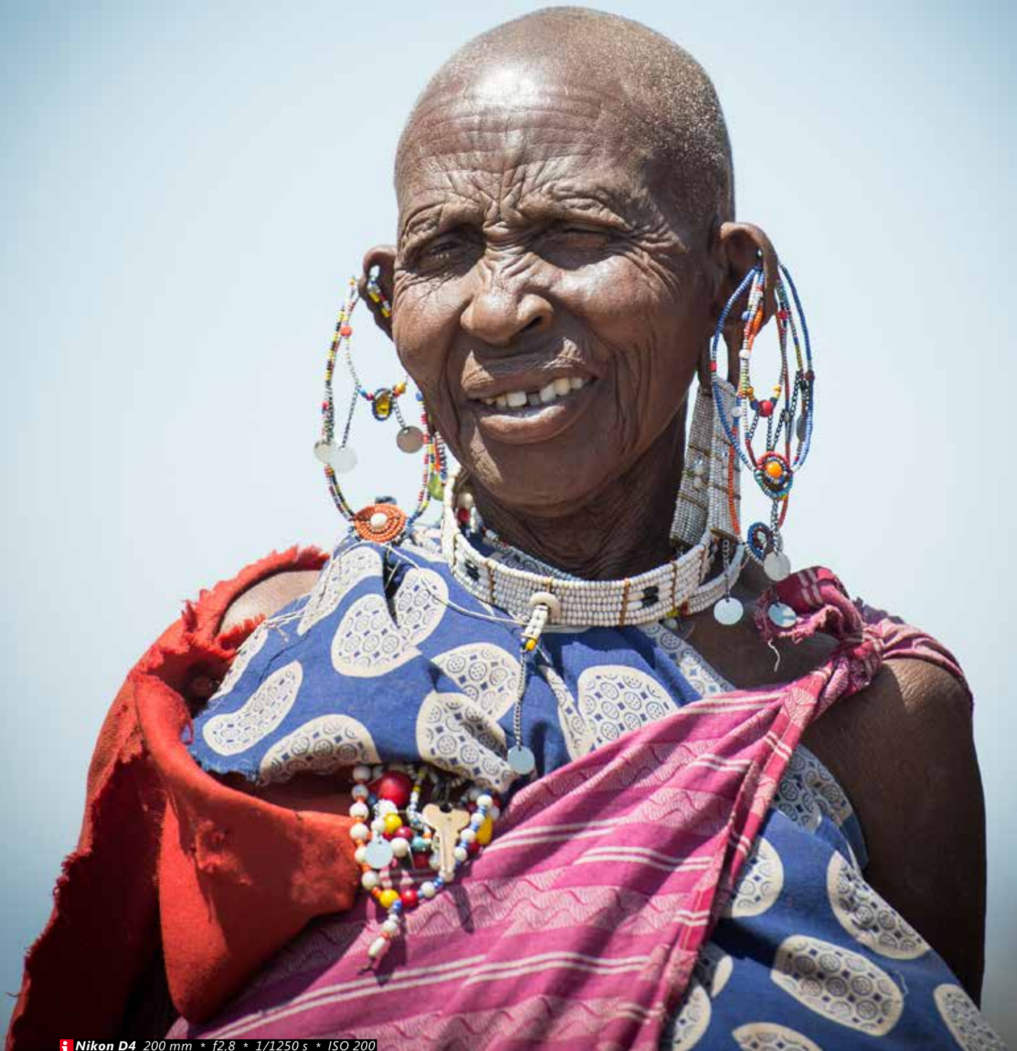
Dorpshoofd In Olpopongi kun je enkele dagen doorbrengen in een Masai-dorp. Deze vrouw is het dorpshoofd en is 91 jaar oud. Juni 2012.

Nikon D4 200 mm * f2,8 * 1/1250 s * ISO 200